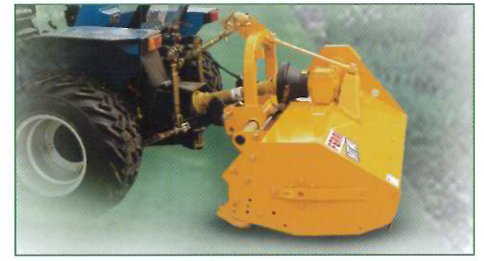
Versione 3 MTR per trattori a guida reversibile. Tractors with reversible drive or for front version (vers. 3 MTR). Version 3 MTR pour attelage frontal ou pour tracteur à poste réversible. Ausführung 3 - MTR für Schlepper mit Drehsitz oder mit Frontzapfwelle