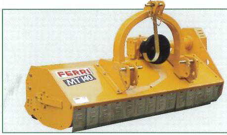
Versione 1 con attacco a 2 posizioni. Central and offset linkage (vers. 1). Version 1 attelage fixe 2 positions. Ausführung 1 3-Pkt. Anschluß mit 2 Positionen.