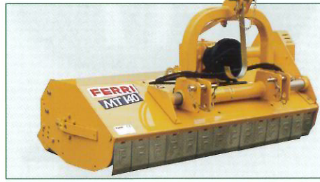
Versione 2 con attacco mobile e martinetto idraulico. Hydraulic sliding linkage (vers. 2) Version 2 attelage à déport hydraulique. Ausführung 2 3-Pkt. mit Zylinder bzw. hydraulischer Seitenverschiebung